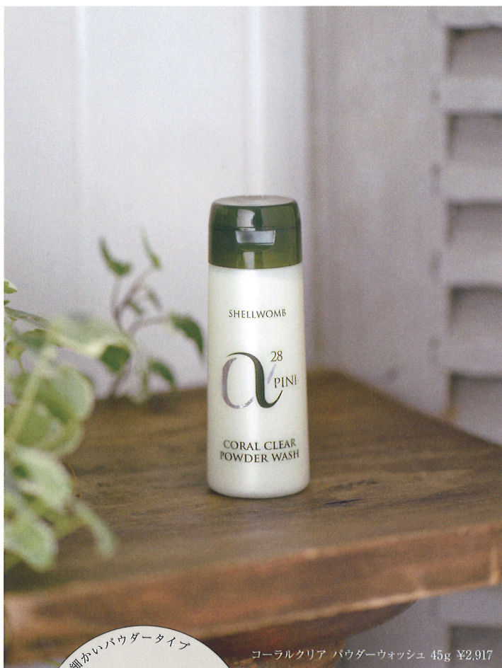
コーラルクリア パウダーウォッシュ 45g ¥2,917